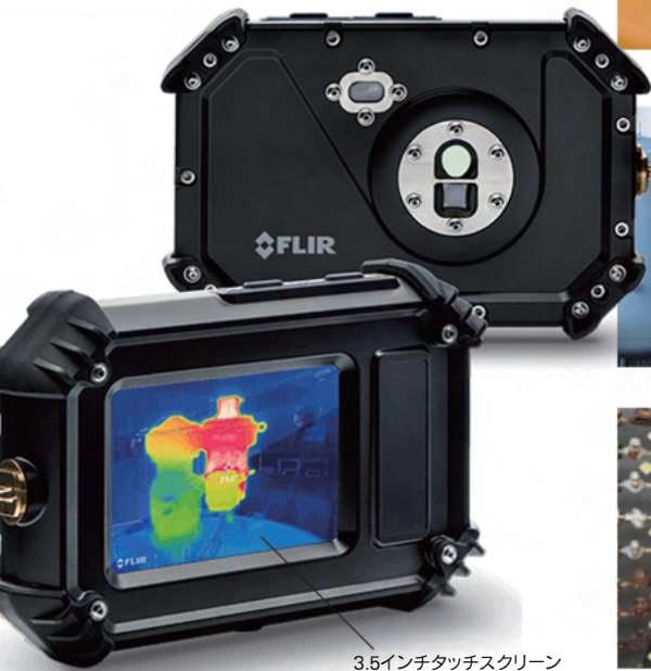
3.5インチタッチスクリーン 熱画像輪郭補正MSX搭載